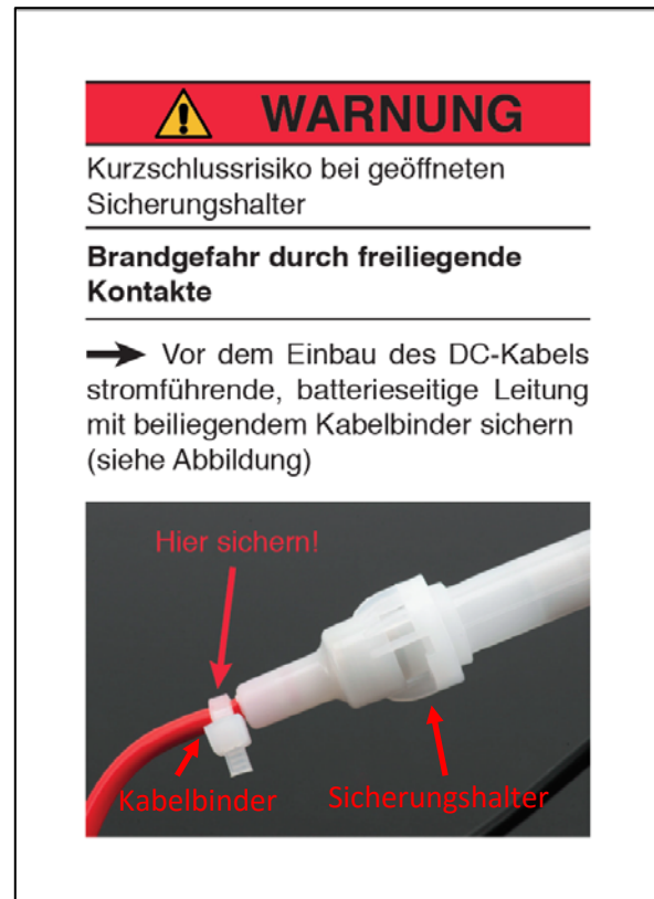
Abbildung 1: Warnhinweis

Sollten Sie Ladehalterungen mit den genannten Datumscodes nutzen, prüfen Sie bitte ob das DC-Kabel evtl. defekt an Sie geliefert wurde oder bereits ein Austausch im Nachhinein stattfand und Sie eine neuere Version (mit Kabelbinder) verbaut haben.